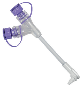
Vinklad kopplingslang med medicinport