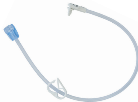
Vinklad kopplingslang utan medicinport