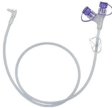
Vinklad kopplingslang med medicinport